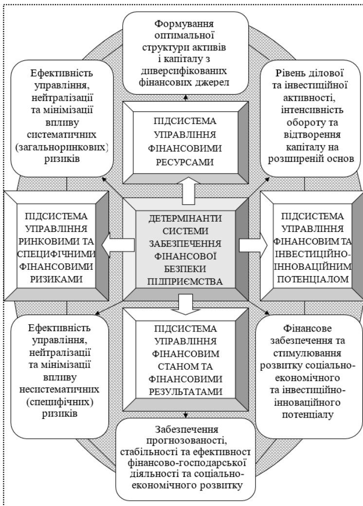
Рис. 2. Складові детермінанти системи забезпечення фінансової безпеки суб'єктів підприємництва (розроблено авторами)

На рис. 2 наведено ключові детермінанти ефективної системи забезпечення фінансової безпеки суб'єктів підприємництва, що спрямовані на її формування, зміцнення та подальший розвиток.